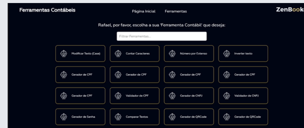
Módulo Ferramentas Contábeis ZenBookee: Disponível em zenbookee.online