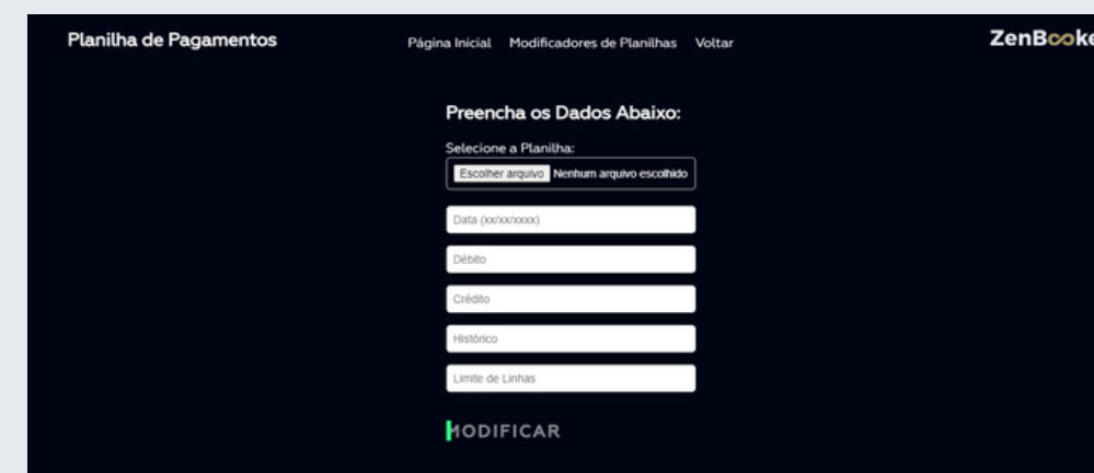
Módulo Modificador de Planilhas ZenBookee: Disponível em zenbookee.online